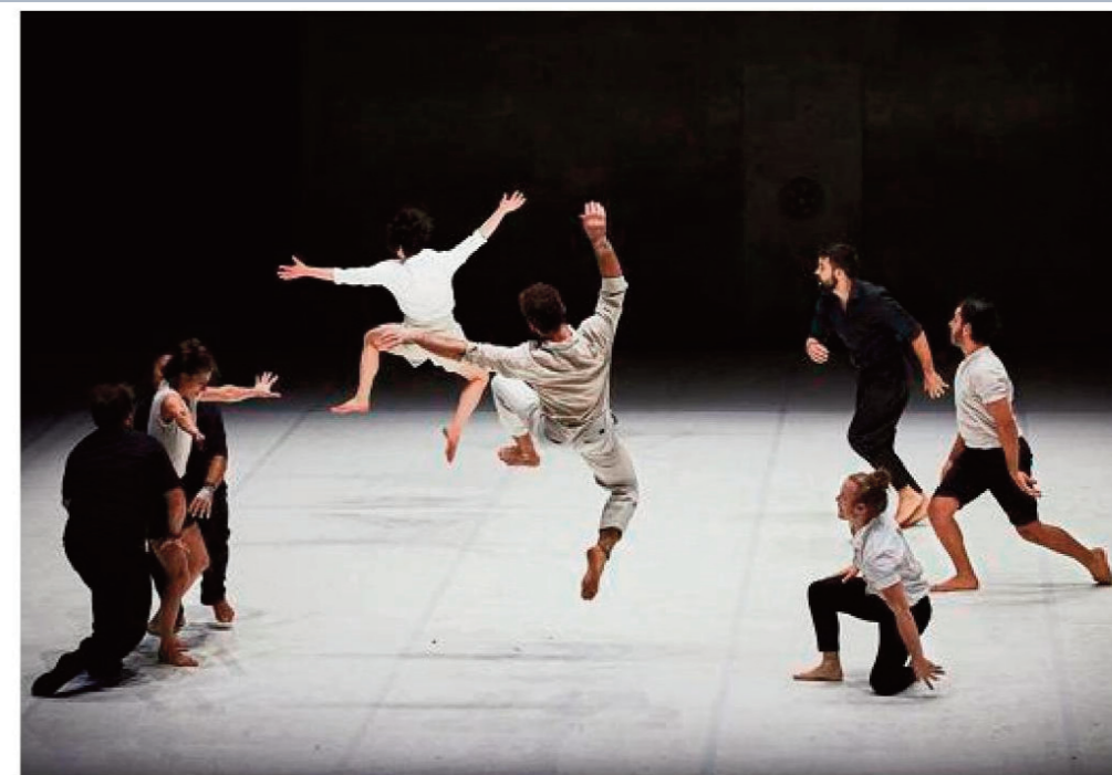
« Möbius », par la compagnie XY, à l'Espace Chapiteaux de La Villette, à Paris (19 e ).

Accélération, brusques langueurs, suspensions immobiles et reprises d'énergie se succèdent