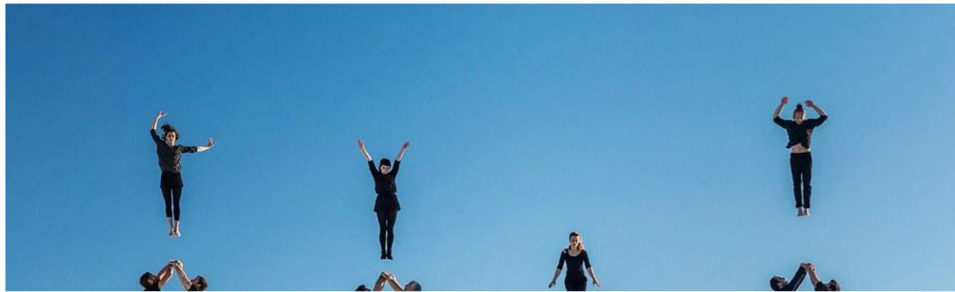
La précision des figures acrobatiques est ici une obligation, même si elle n'entrave jamais la poésie du résultat.

Philippe Noisette / Critique Danse | Le 16/10 à 17:15, mis à jour le 17/10 à 10:17